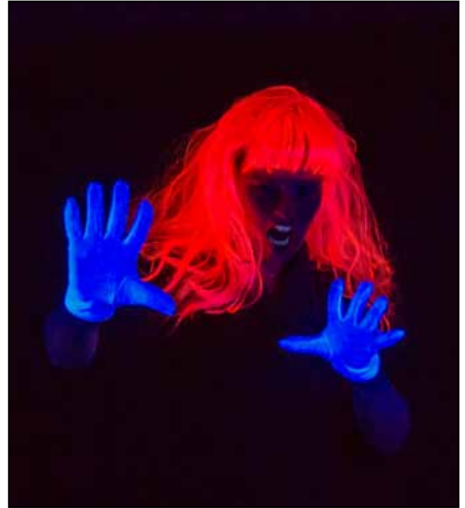
Impressionen aus dem Dark Room

Karten an der Abendkasse erhältlich (5 Euro) Teilnehmerzahl begrenzt