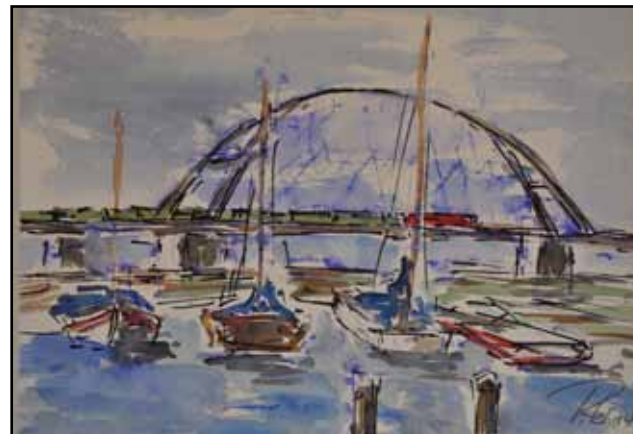
„Ohne Titel“ Erwin Pitzl