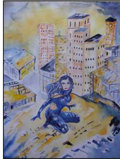
"Science Fiction Aquarell", Sonja Voigt