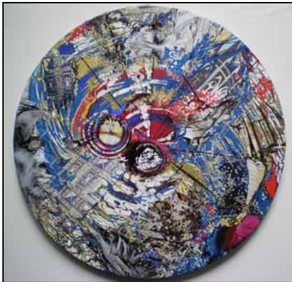
"Big Bang" Klara Singer