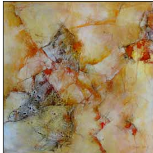
Ohne Titel, Doris Sperr