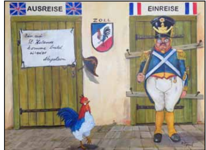
„Napoleons letzter großer Irrtum“, Peter Spät