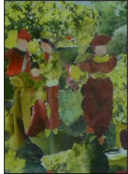
„Im Grünen“, Hannelore Fent