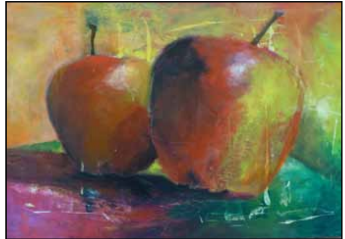
"Duo", Ute Grönheim