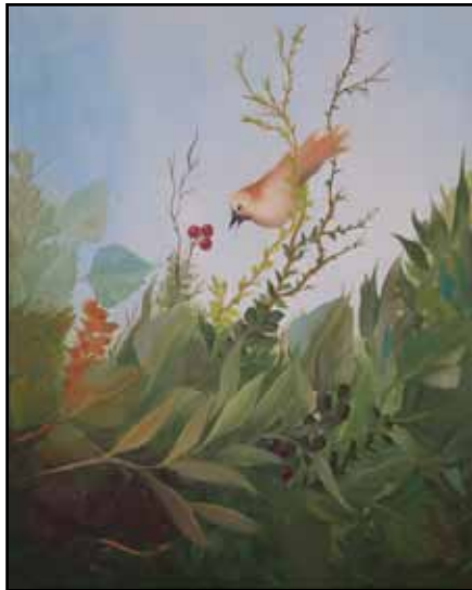
"Blume", Eva Puchtler

Leitung Eva Puchtler Tel.: 0179 / 1294675 info@atelier-puchtler.de