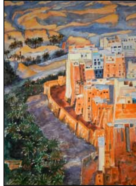
„Ohne Titel“, Else Weiß