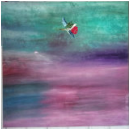
Surreal 2021 - Jakob Strasser