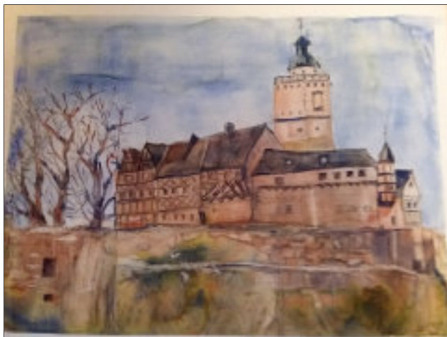
Burg Falkenstein- Heidrun Richter