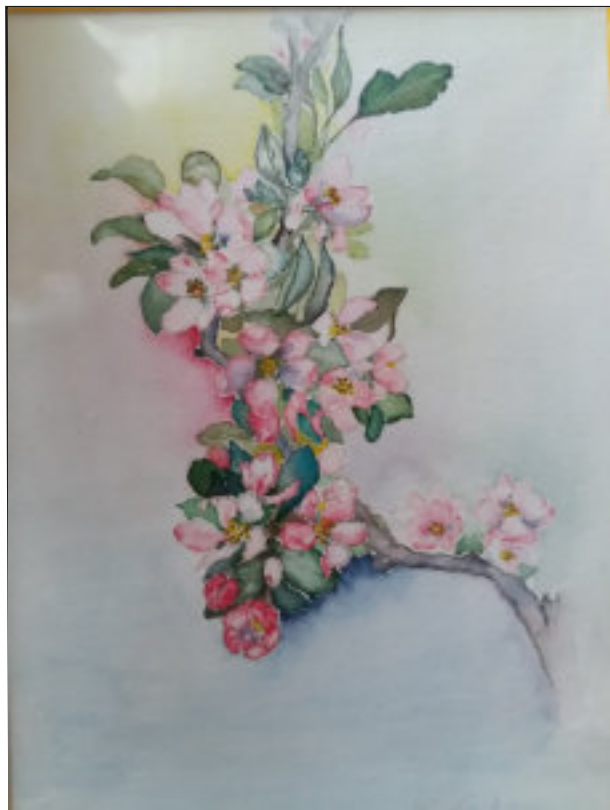
Blumen - Else Weiss