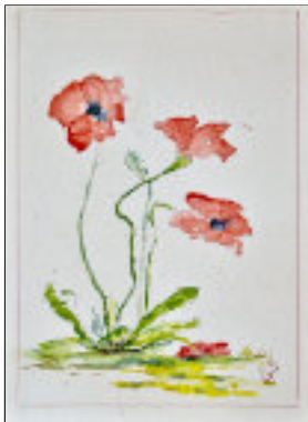
Mohnblumen - Ulli Pfeiffer