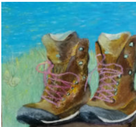
Am See - Bärbel Eiselstein