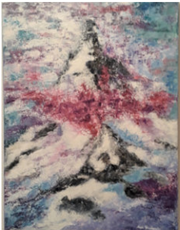
Matterhorn in Wolken - Angela Grabenmaier