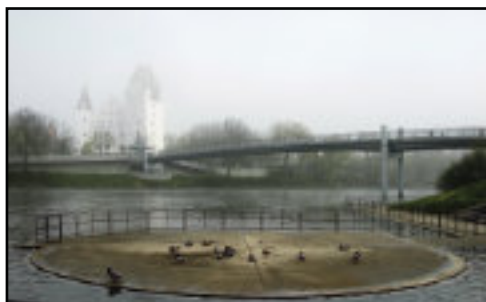
„Blick auf das Neue Schloß Ingolstadt“, Rainer Rickert