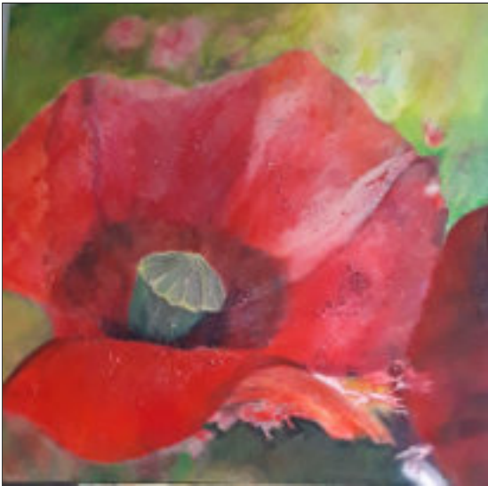
Mohn - Bärbel Eiselstein